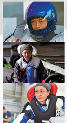
63rd BOAT RACE DERBY 福岡 10/25~30